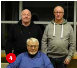
4 ASB Regionalverband Ostholstein